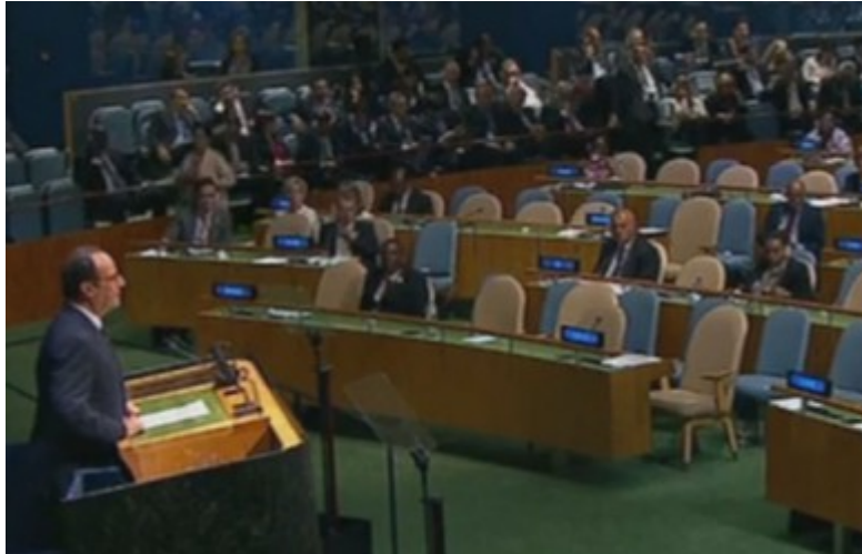
François Hollande devant l'ONU (capture d'écran).