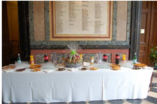
Le verre de l'amitié