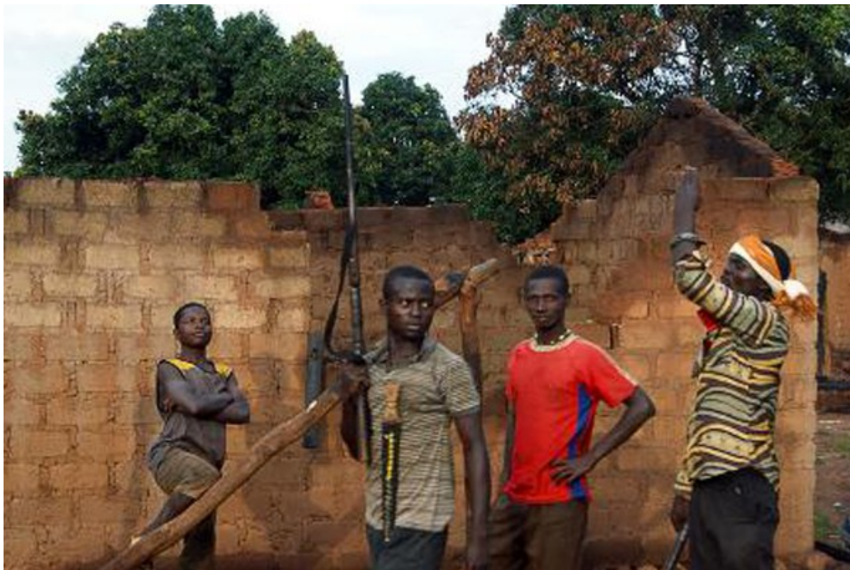
De jeunes hommes armés patrouillent près d'une maison incendiée à Bogangolo en Centrafrique, le 11 octobre 2013.