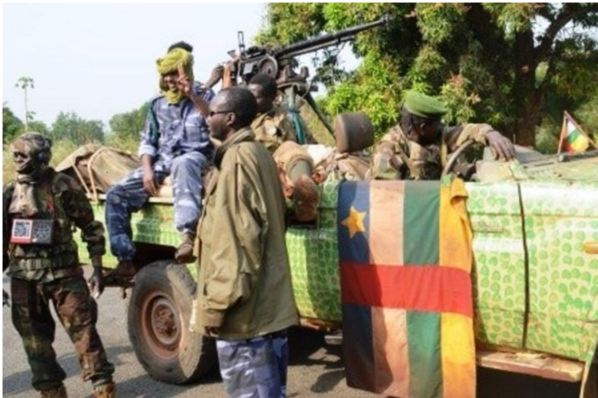
Des éléments rebelles de la Séléka autour d'un véhicule pris chez les forces armées centrafricaines. Pacôme PABANDJI le 17 février 2013 à 14:14 - atelier.rfi.fr/