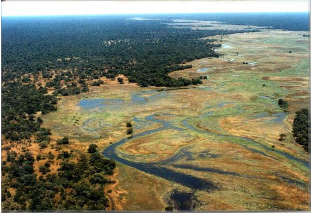
RCA : parc national de la Gounda, Photo : José Tello

Ils constituent, avec l'Amazonie, le poumon du monde en raison non seulement de la grande forêt équatoriale qu'ils abritent mais de la densité et la richesse de leur écosystème.