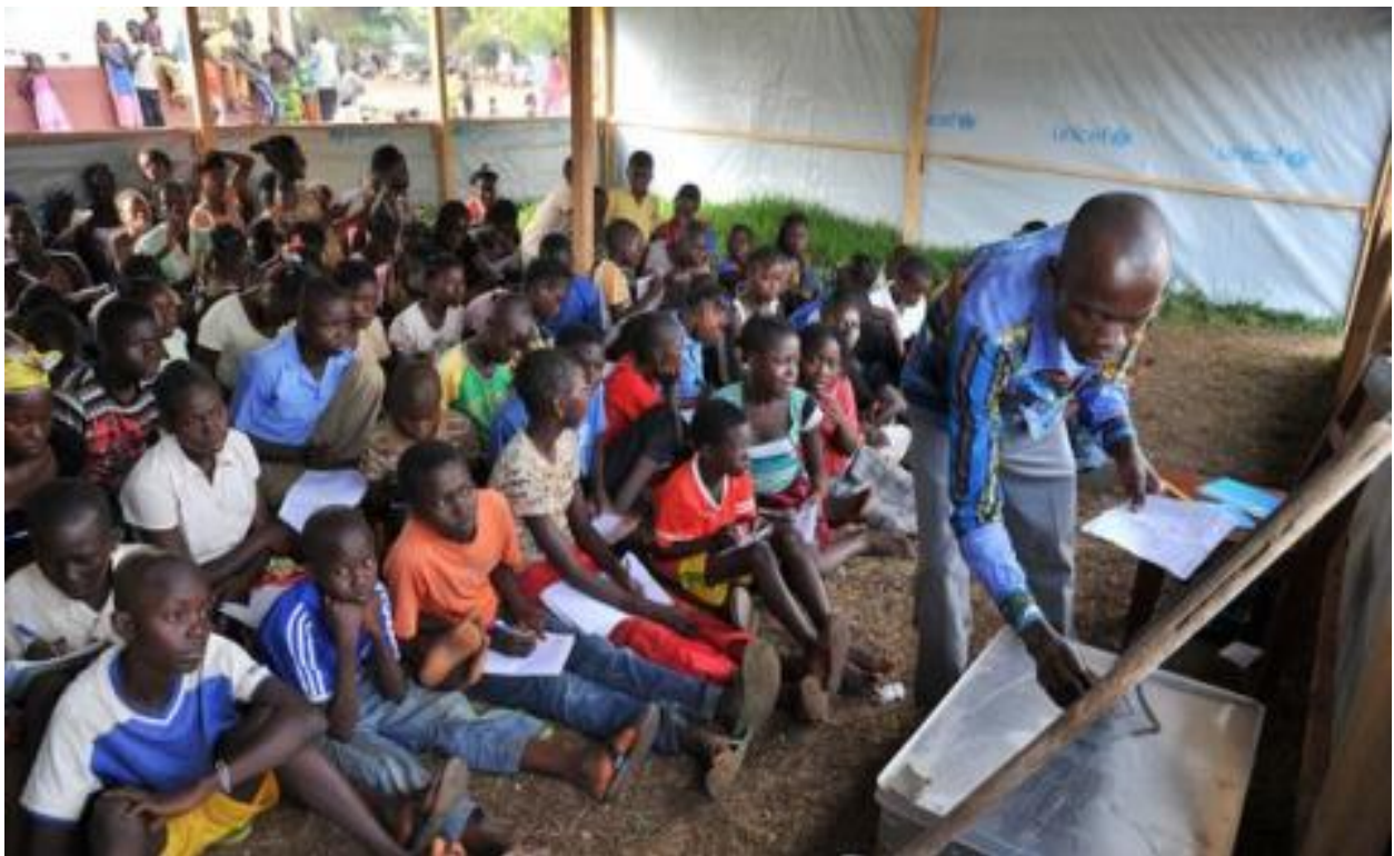
RCA, 2015. Source : APA 15/6/

« Pour espérer sortir du chaos des dictatures, de la pauvreté et de l'émigration, une solution : éduquer, former les enfants d'aujourd'hui pour en faire demain, des citoyens conscients et responsables dans tous les secteurs de la vie », AECA.