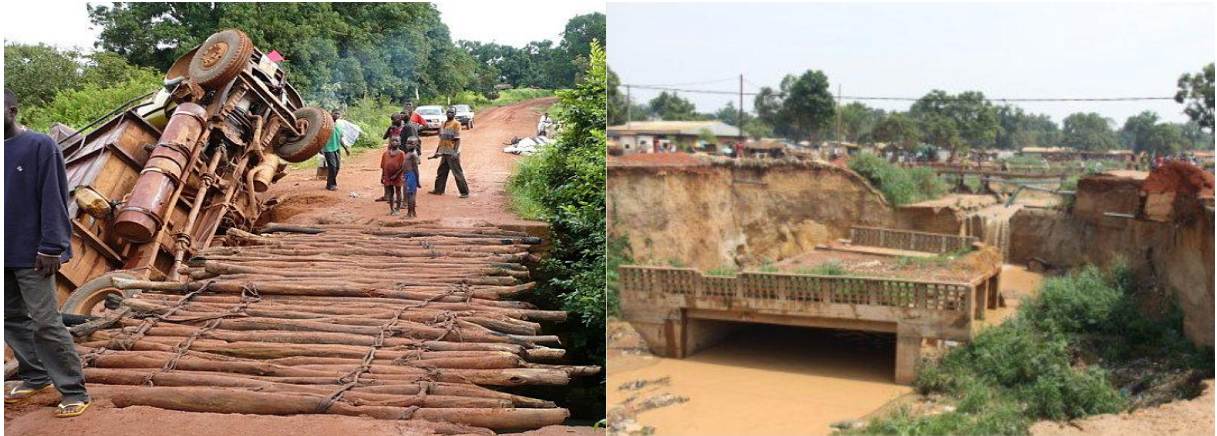
RCA, 2012.

Infrastructures défailtantes suite à une mal gouvernance chronique et effets du changement climatique