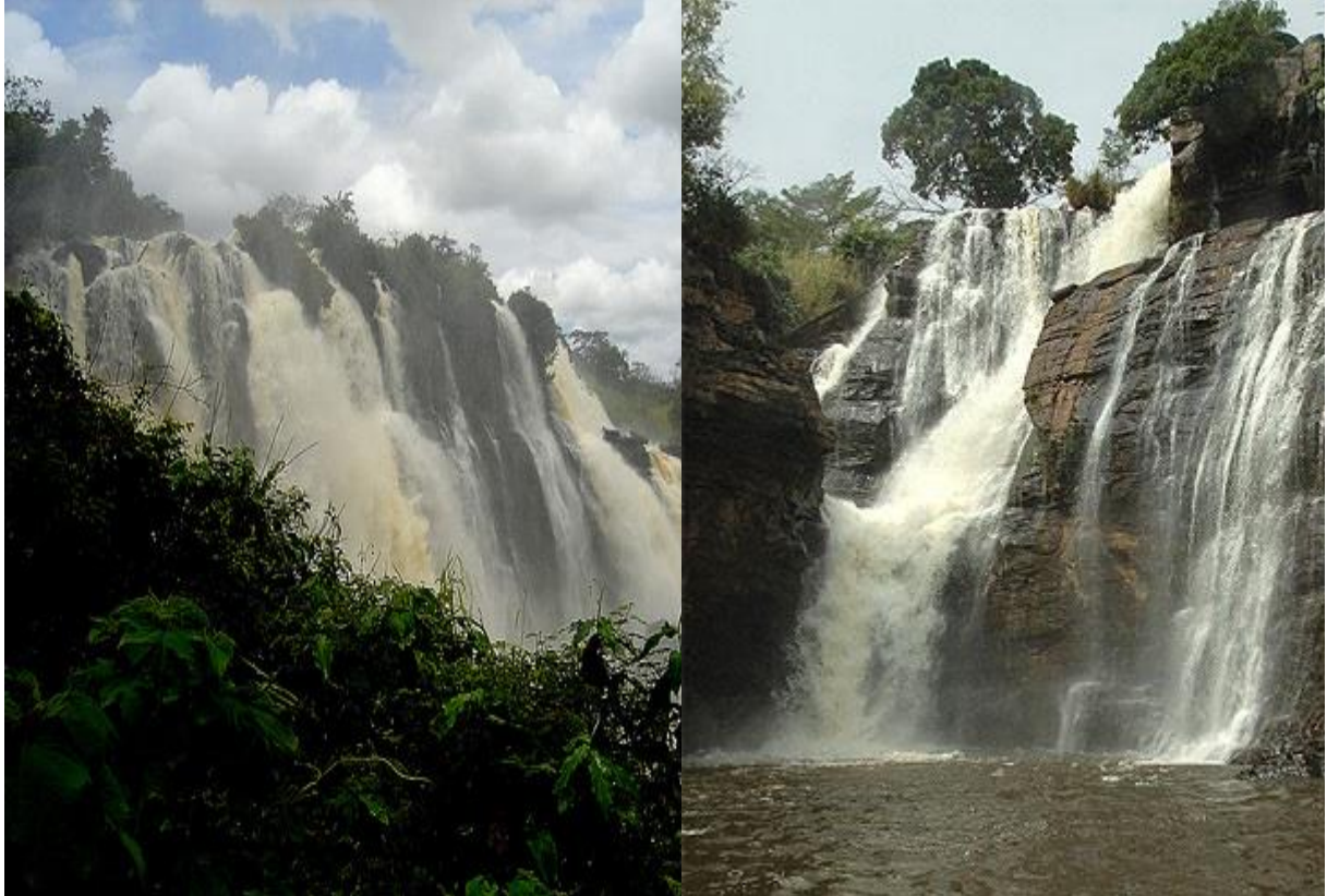
Les Chutes de Boali (80 km de Bangui) en 1965 et en 2012 suite sécheresse (changement climatique)